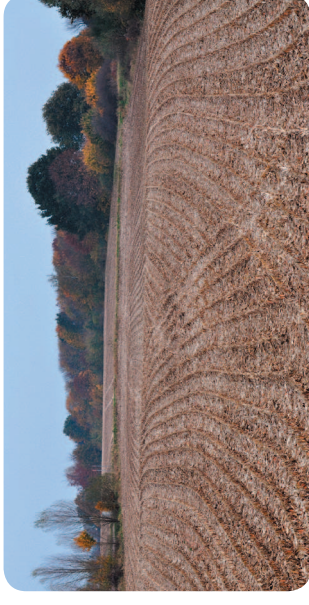
Ist - Zustand der Fläche im Herbst 2009

Da jetzt noch die trostlosen Stoppeln eines Maisackers stehen, wird es bald grün, wird es bald summen und zwitschern. Es locken gut riechende Blüten und wohlschmeckende Früchte mit klingenden Namen: Rote Sternrenette, Goldparmäne, Clapps Liebling und viele mehr. Alles alte Sorten, die hier wunderbar gedeihen werden.